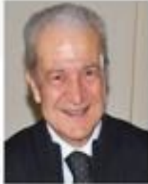
Min. ARIF ATILGAN [Eski] Mimarlar Odası Başkanı